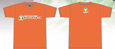
癒しの山歩き女子部公式Tシャツ